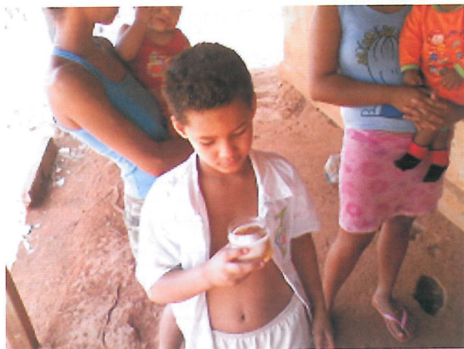
Figura 1. Simulação da Formação da Cárie.

No tema higiene oral e doença periodontal, o objetivo foi possibilitar a compreensão da etiopatogenia da doença periodontal, com enfoque nas causas, conseqüências e prevenção da doença. A estratégia utilizada partiu da analogia entre a árvore e o dente. Comparamos as raízes da árvore com a raiz do dente, a grama que cobria a terra com a gengiva, a terra que segura a árvore com o osso alveolar que suporta o dente (Figura 2). Nesta atividade percebemos que as famílias desconheciam a presença do osso alveolar, pois entendiam que a gengiva é quem suportava o dente na cavidade bucal. Com a analogia tornou-se mais fácil discutir a anatomia dental e o processo de formação da doença periodontal 7 .