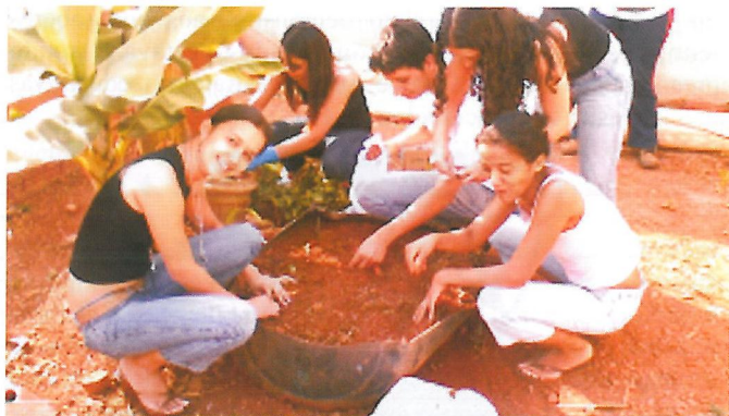
Figura 4. Sensibilizando as Famílias a Cultivando Seus Próprios Alimentos.

O projeto possibilitou trabalhar com metodologias novas, pouco utilizadas na área da odontologia tradicional, oportunizando, aos acadêmicos, a experiência de educação em saúde bucal, que são mais eficazes.