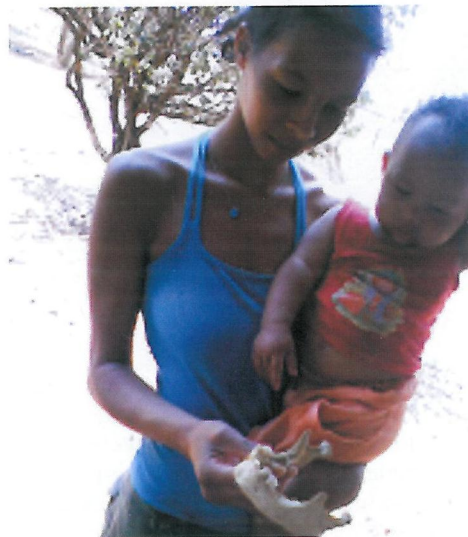
Figura 3. Compreendendo os Processos Anatômicos.