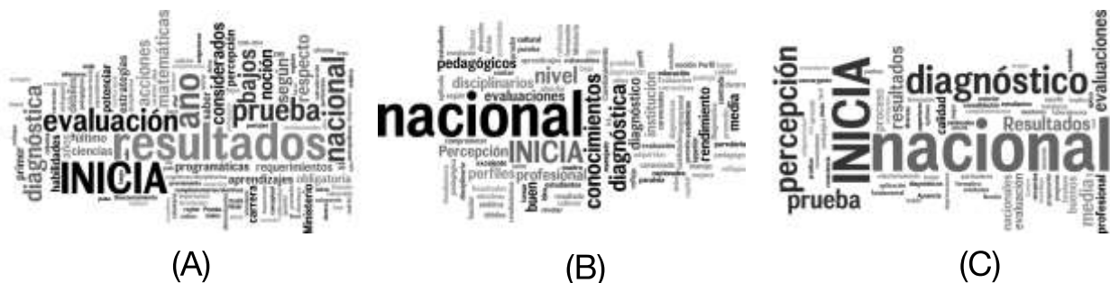
Figura 2. Comparación de percepciones generales según institución (inicia y evaluación diagnóstica nacional) donde A: institución masiva estatal, B: institución masiva privada y C: institución tradicional de élite.

Considerando a la acreditación como un proceso voluntario al que se incorporan las instituciones autónomas para contar con certificación de calidad de sus procesos internos y resultados, los actores perciben la inserción de evaluaciones diagnósticas como un avance, relativo a la mejora continua de los procesos formativos institucionales (Figura 2). Acá se releva la evaluación llamada INICIA, en la medida que sirve para orientar acciones de mejora.