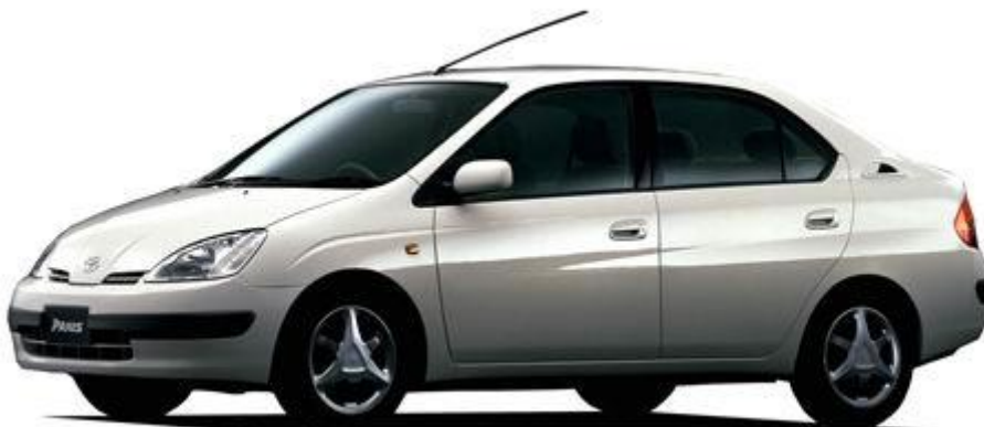
Figura 1. Toyota Prius 1997

A Toyota, em 1997 lançou no mercado japonês o Prius, um sedã híbrido. No mesmo ano a Audi lançou o Duo, sendo o primeiro híbrido do mercado europeu, que foi um fracasso. [5]